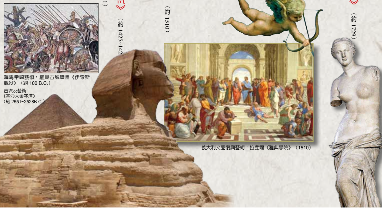
羅馬帝國藝術：龐貝古城壁畫《伊索斯戰役》 (約 100 B.C.) 古埃及藝術：《基沙大金字塔》 (約 2551-2528B.C.) 義大利文藝復興藝術：拉斐爾《雅典學院》 (1510) 古希臘石雕藝術：《米羅的維納斯像》 (約 200 B.C.) 法國新古典主義：安格爾《宮女》 (1814) 法國巴比松畫派：米勒《拾穗者》 (1857) 挪威表現主義：孟克《吶喊》 (1893) 美國普普藝術：安迪羅荷《瑪利蓮露露像》 (1967) 西班牙超現實主義：達利《飛舞的蜜蜂所引起的夢》 (1944) 法國後印象派：高更《我們從何處來？我們是甚麼？我們往何處去？》 (1897) 法國野獸派：馬蒂斯《舞蹈》 (1909-1910) 法國達達主義：杜象《下樓梯的裸女第2號》 (1912) 西班牙立體派：畢卡索《三個樂師》 (1921) 荷蘭風格派：蒙德里安《百老匯爵士樂》 (1942-1943) 俄羅斯超現實主義：夏卡爾《高舉酒杯的雙人像》 (1917) 美國抽象表現主義：波洛克《構圖31號, 1950》 (1950) 美國普普藝術：安迪羅荷《瑪利蓮露露像》 (1967) 法國現代雕刻：羅丹《沈思者》 (1902)