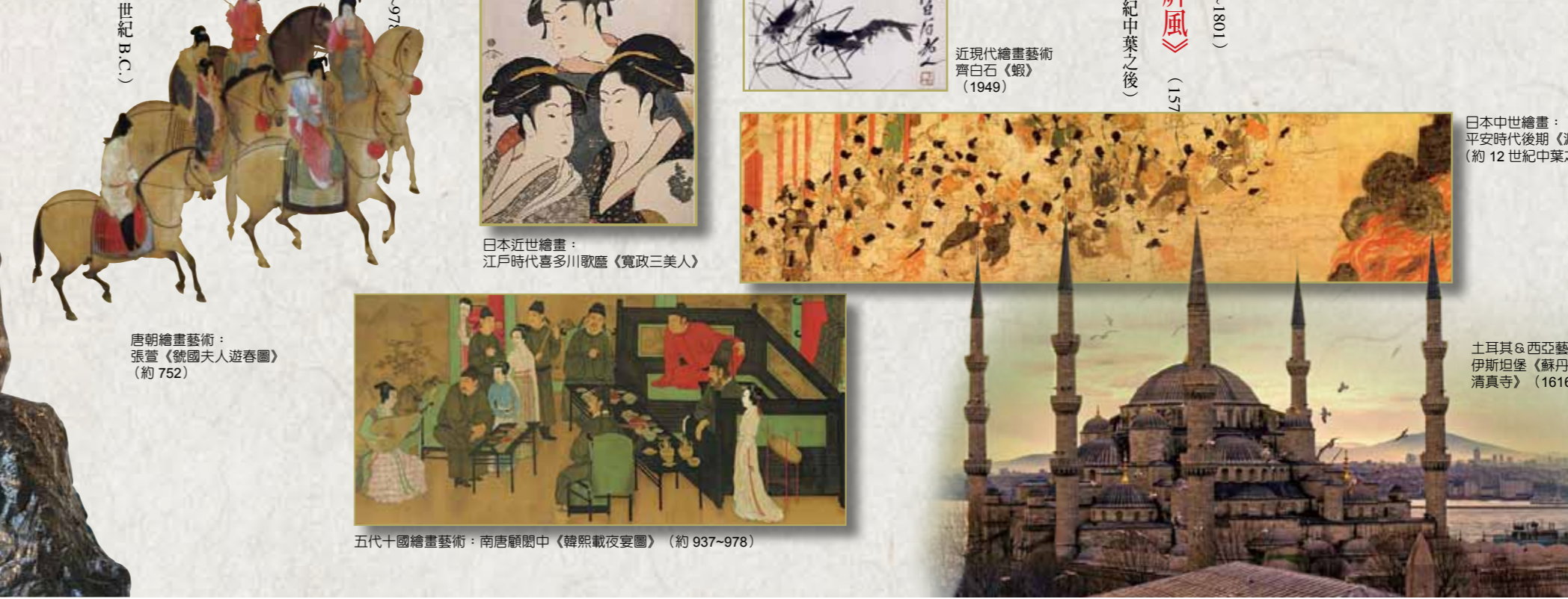
秦朝陶塑藝術：《秦始皇兵馬俑》 (約 246-208 B.C.) 西漢繪畫藝術：《湖南長沙馬王堆漢墓《彩繪帛畫》》 (約 1世紀 B.C.) 東晉繪畫藝術：顧愷之《洛神賦圖》 (約 344-405) 東晉書法藝術：王羲之《蘭亭序》 (約 303-361) 佛教藝術寶庫：敦煌莫高窟 (約 366-13世紀) 唐朝繪畫藝術：張萱《虢國夫人遊春圖》 (約 752) 唐朝繪畫藝術：李昭道《明皇幸蜀圖》 (約 713-741) 五代十國繪畫藝術：南唐顧闳中《韓熙載夜宴圖》 (約 937-978) 北宋繪畫藝術：范寬《谿山行旅圖》 (約 1000) 北宋繪畫藝術：張擇端《清明上河圖》 (約 1100-1138) 北宋繪畫藝術：趙佶《瑞鶴圖卷》 (1112) 南宋繪畫藝術：馬遠《山徑春行圖》 (約 1200 前後) 元代繪畫藝術：趙孟頫《鵲華秋色圖》 (1295) 元代繪畫藝術：黃公望《富春山居圖》 (1347) 元代繪畫藝術：鄭思肖《墨蘭圖》 (約 1279-1316) 明代繪畫藝術：文徵明《綠蔭草堂圖》 (1516) 明代繪畫藝術：徐渭《墨葡萄圖》 (約 1558-1568) 清代繪畫藝術：石濤《搜盡奇峰打草稿》 (1691) 清代繪畫藝術：金農《玉壺春色圖》 (1761) 近現代繪畫藝術：齊白石《蝦》 (1949) 近現代繪畫藝術：張大千《廬山圖》 (1982) 臺灣繪畫藝術：廖繼春《有香蕉樹的院子》 (1928) 日本古代繪畫：天平時代《鳥毛立女屏風圖》 (約 713-755) 日本中世繪畫：平安時代後期《源氏物語繪卷》 (約 12世紀中葉之後) 日本近世繪畫：桃山時代《狩野永德《洛中、洛外圖屏風》》 (157) 日本近世繪畫：江戶時代喜多川歌麿《寬政三美人》 (約 937-978) 韓國新羅王朝藝術：慶州《石窟庵》 (約 800) 韓國朝鮮王朝藝術：安堅《夢幻桃源圖》 (1447) 韓國朝鮮王朝藝術：金弘道《風俗畫帖》 (18世紀末葉) 緬甸蒲甘王朝藝術：江喜陀時代《阿難陀寺》 (1091) 柬埔寨吳哥王朝藝術：吳哥窟 (12-15世紀) 印尼夏連特王朝藝術：日惹《婆羅浮屠》 (8世紀後半葉) 泰國曼谷王朝藝術：曼谷《玉佛寺》 (1875) 印度孔雀王朝藝術：桑奇大舍利塔 (約 3世紀 B.C. 中葉-西元 1世紀初) 印度犍陀羅藝術：哈達佛陀頭像 (約 4世紀) 印度笈多王朝藝術：阿旃陀石窟 (約 2世紀 B.C.-西元 7世紀) 印度中世紀藝術：卡朱拉候神廟群 (約 950-1203) 印度笈多王朝藝術：泰姬瑪哈陵 (1632-1648) 印度笈多王朝藝術：阿克巴本紀 (1590-1597) 伊朗波斯帝國藝術：波斯波利斯宮殿群 (約 6世紀 B.C.) 伊蘭波斯藝術：麥地那《大清真寺》 (710) 土耳其 & 西亞藝術：伊斯坦堡《蘇丹艾哈邁德清真寺》 (1616) 墨西哥阿茲特克藝術：迪奧提華康遺蹟 (約 200 B.C.-650) 秘魯印加帝國藝術：馬丘比丘古城遺蹟 (約 11-16世紀) 非洲藝術：馬利《多貢坐交變人像》 (約 1977) 大洋洲藝術：復活節島《巨石人像》 (約 900 B.C.-1500)